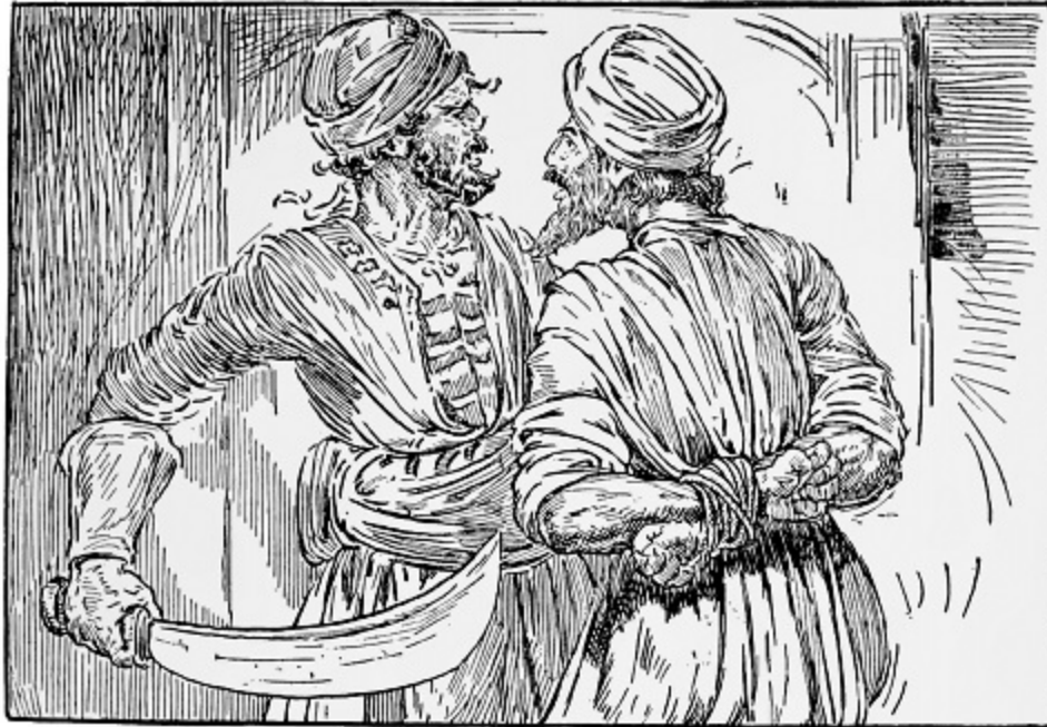
Berver ve Cellat